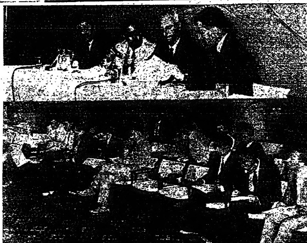
مشهدان من المؤتمر الصحفي الذي عقده لجنة انتقال القدس أمس وأذاعت فيه القاء الذي وجهه سكان القدس إلى الضمير العالمي والامة العربية